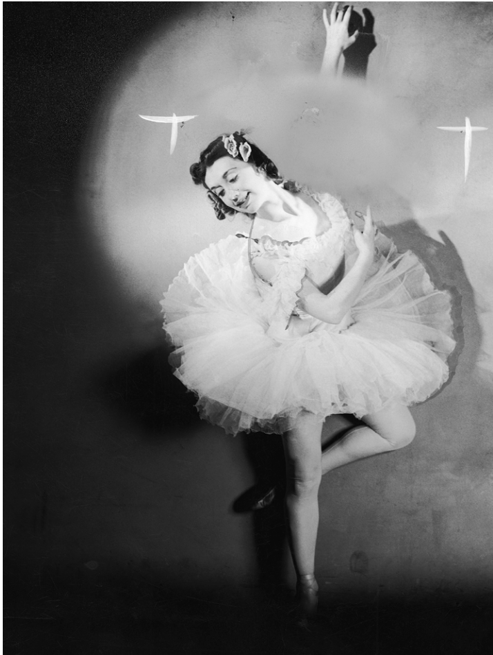
Sebastian Riemer, Ballerina (Alma) , 2015 © VG Bild-Kunst, Bonn 2019; Courtesy Galerie DIXg, Paris

● Heidelberger Kunstverein Künstler*innen: Sebastian Riemer / Thomas Ruff / Clare Strand / Stanley Wolukau-Wanambwa