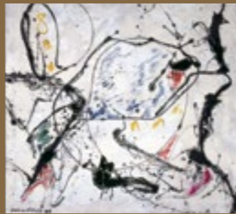
Jackson Pollock, No. 18 , 1948, Öl und Duocolack auf Leinwand, 89,2 × 99,3 cm, Wilhelm-Hack-Museum, Ludwigshafen