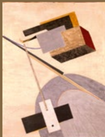
El Lissitzky, Proun 23 N (B 111) , 1920/21, Tempera, Bleistift, Leimfarbe und Materialauftrag auf Holz, 59 × 45,7 cm, Wilhelm-Hack-Museum, Ludwigshafen

Die Jubiläumspräsentation Darf ich Dir meine Sammlung zeigen? 40 Jahre – Meisterwerke zu Gast wird das gesamte Haus bespielen und in zwölf Kapiteln die Geschichte der Abstraktion vom Expressionismus über Konstruktivismus, De Stijl und Konkrete Kunst bis in die Gegenwart erzählen. Die Gratulanten werden in Form von bedeutenden Leihgaben die Werke der Museumssammlung ergänzen und in der Gegenüberstellung einen fruchtbaren Dialog eröffnen. In den Leihgebern spiegelt sich eine Auswahl der wichtigsten Institutionen, mit denen das Wilhelm-Hack-Museum in den letzten 40 Jahren im engen Austausch stand. So werden erstklassige Arbeiten von Kurt Schwitters aus dem Sprengel Museum Hannover, Sarah Morris aus der Städtischen Galerie im Lenbachhaus und Kunstbau München, Sammlung KiCo, Lyonel Feininger aus dem Museo Nacional Thyssen-Bornemisza Madrid, César Domela aus dem Gemeentemuseum Den Haag oder Mark Rothko aus dem Museum Wiesbaden in der Ausstellung zu sehen sein.