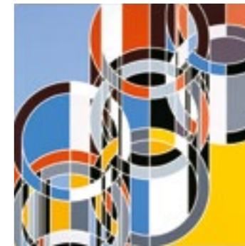
Sarah Morris, 1972 (Rings) , 2007, Haushaltslack auf Leinwand, 214 × 214 cm, Städtische Galerie im Lenbachhaus und Kunstbau München, Sammlung KiCo