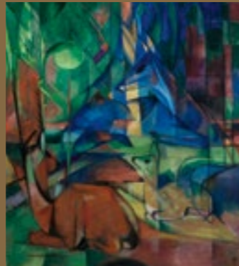
Franz Marc, Rehe im Walde II , 1914, Öl auf Leinwand, 110 × 100 cm, Staatliche Kunsthalle Karlsruhe

Zeitgenössische Künstler ergänzen die Ausstellung mit ortsspezifischen Werken. So gestaltet der Turner-Preisträger Martin Creed die zentrale Eingangswand des Museums neu. Leni Hoffmann setzt sich mit der Architektur und der Glasfassade des Museums auseinander und der rumänische Künstler Dan Perjovschi kommentiert zeichnerisch die Ausstellung und das Museum auf ironische Weise.